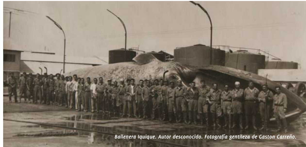
Ballenera Iquique. Autor desconocido. Fotografía gentileza de Gaston Carreño.